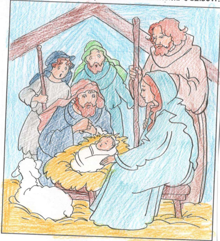
Doplňovačka (Lk 2, 13-18)

A hneď sa k anjelovi pripojilo množstvo nebeských zástupov, zvelebovali Boha a hovorili: „ SLAV Bohu na výsostiach a na zemi POKOJ ľuďom dobrej vôle.“ Keď anjeli odišli od nich do neba, PASTIERI si povedali: „Podme teda do Betlehema a pozrime, čo sa to stalo, ako nám oznámil Pán.“ Poponáhľali sa a našli Máriu a Jozefa i PIETA uložené v jaslích. Keď ich videli, vyrozprávali, čo im bolo povedané o tomto dieťati. A všetci, ktorí to počúvali, PÍVILI sa nad tým, čo im pastieri rozprávali.