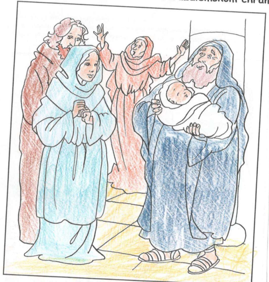
Doplňovačka (Lk 2, 22-38)

Keď uplynuli podľa Mojžišovho zákona dni ich očisťovania, priniesli ho do JERUZALEM aby ho predstavili Pánovi. V Jeruzaleme žil vtedy muž menom SIMEON . A keď rodičia prinášali dieťa Ježiša, vzal ho aj on do svojho náručia a velebil Boha. Simeon ich pozhnal a Márii, jeho matke, povedal: „On je ustanovený na pád a na povstanie pre mnohých a tvoju vlastnú dušu prenikne MEČ -, aby vyšlo najavo zmysľanie mnohých srdc.“ Žila vtedy aj prorokynia ANNA , Fanuelova dcéra, z Aserovho kmeňa. Práve v tú chvíľu prišla aj ona, vebila Boha a hovorila o ňom všetkým, čo očakávali vykúpenie JERUZALEM .