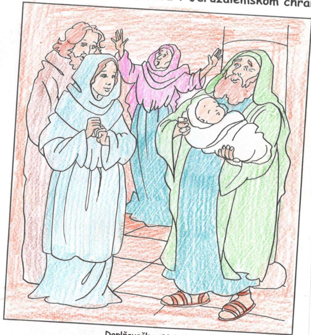
Doplňovačka (Lk 2, 22-38)

Keď uplynuli podľa Mojžišovho zákona dni ich očisťovania, priniesli ho do JERUZALEMA aby ho predstavili Pánovi. V Jeruzaleme žil vtedy muž menom SIMEON . A keď rodičia prinášali dieťa Ježiša, vzal ho aj on do svojho náručia a vebil Boha. Simeon ich požehnal a Márii, jeho matke, povedal: „On je ustanovený na pád a na povstanie pre mnohých a tvoju vlastnú dušu prenikne MEC -, aby vyšlo najavo zmýšľanie mnohých srdc.“ Žila vtedy aj prorokynia ANNA , Fanuelova dcéra, z Aserovho kmeňa. Práve v tú chvíľu prišla aj ona, vebila Boha a hovorila o ňom všetkým, čo očakávali vykúpenie JERUZALEMA .