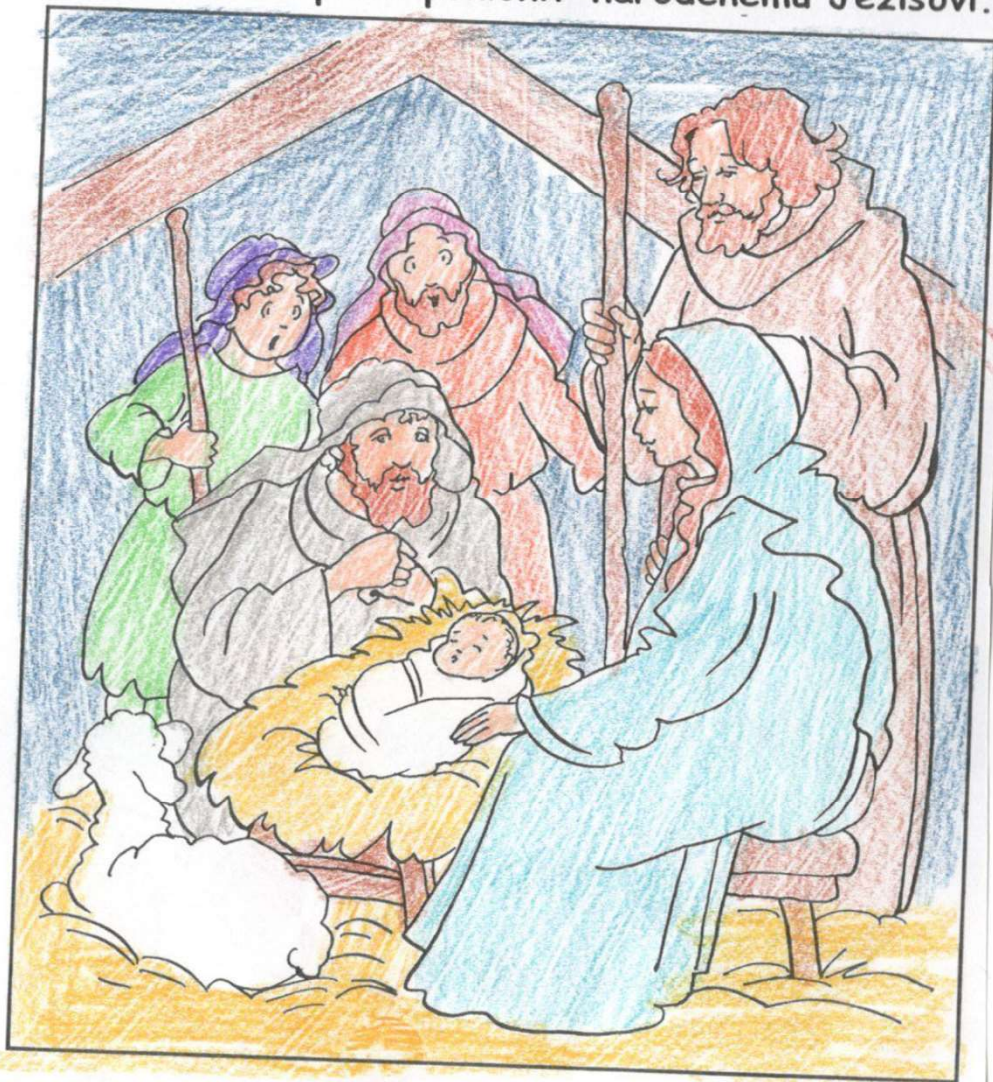
Doplňovačka (Lk 2, 13-18)

A hneď sa k anjelovi pripojilo množstvo nebeských zástupov, zvelebovali Boha a hovorili: „ SLÁVA Bohu na výsostiach a na zemi POKOJ ľuďom dobrej vôle.“ Keď anjeli odišli od nich do neba, PASTIERI si povedali: „Podme teda do Betlehema a pozrime, čo sa to stalo, ako nám oznámil Pán.“ Poponáhľali sa a našli Máriu a Jozefa i DIETĽA uložené v jaslách. Keď ich videli, vyrozprávali, čo im bolo povedané o tomto dieťati. A všetci, ktorí to počúvali, DIVILI sa nad tým, čo im pastieri rozprávali.